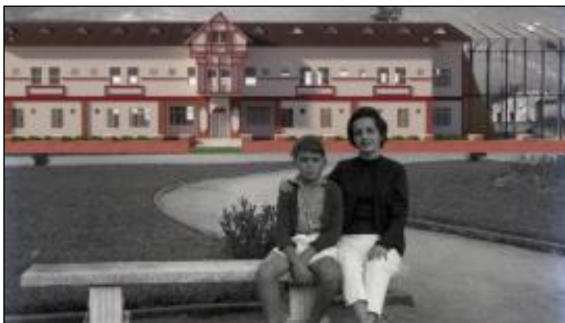
Figura 1 – Fotomontagem do Centro Cultural Imperador sobre foto de turista em 1979

O Centro Cultural Imperador foi ponderado a fim de valorizar um edifício já existente. Com a necessidade de preservação de um patrimônio da cidade, o Hotel Imperador teve a alteração dos usos de seus espaços, porém sua fachada marcante permaneceu preservada (Figura 1). Com os novos usos, o edifício foi dividido em três pavimentos que tem por objetivo apresentar e ministrar a cultura daquela sociedade.