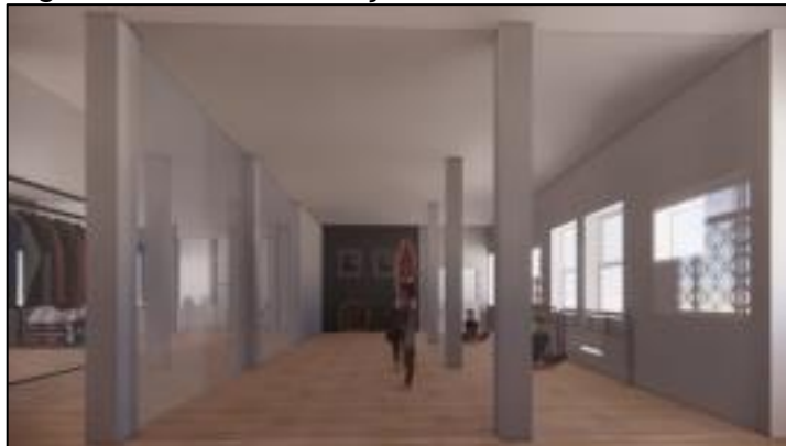
Figura 3 – Sala de dança situada no térreo