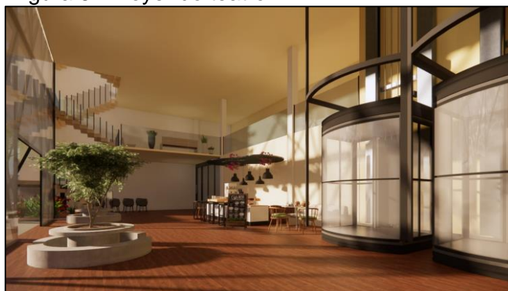
Figura 6 – Foyer do teatro

A área externa do edifício inclui espaços de permanência com jardins, um espelho d'água e vagas para bicicletas, visando proporcionar conforto aos frequentadores. Ao entrar no edifício, há um foyer de aproximadamente 188m 2 com uma bomboniere, pequena recepção e banheiros femininos, masculinos e para PCD (Figura 6). No térreo, também se encontra o salão do teatro, com cerca de 388m 2 , e acessos verticais através de duas escadas e dois elevadores panorâmicos. No segundo pavimento, há um mezanino do teatro com aproximadamente 42m 2 e banheiros adicionais. O terceiro pavimento é dividido em um salão de ensaio de 185m 2 , visível da rua através da fachada principal, e um cine-auditório de 144m 2 , projetado para atender à demanda por cinema na região (Figura 7), com banheiros no final do corredor. O quarto e último pavimento oferece um amplo espaço cultural aberto ao público, com diversas atividades e apresentações menores, também com banheiros para todos os públicos.