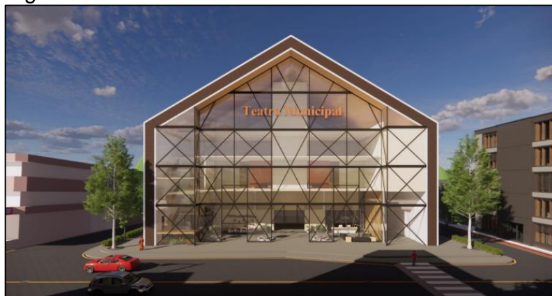
Figura 5 – Fachada frontal do teatro.

A volumetria do Teatro Municipal foi pensada a fim de se assemelhar com as estruturas do seu entorno, todavia com as referências sendo aplicadas de forma inovadora. A edificação foi dividida de forma simétrica, sendo um grande quadrilátero, com uma cobertura em duas águas, e um afastamento frontal de 2 metros (Figura 5) .Sua fachada principal é voltada para a Travessa Augusto Schwambach, sendo toda revestida em vidro com estruturas metálicas que se assemelham a enxaimel, com a finalidade de gerar um maior interesse e incentivo às pessoas adentrarem ao edifício. Seu interior foi dividido em 4 pavimentos, com subdivisões claras a respeito de áreas sociais e privadas.