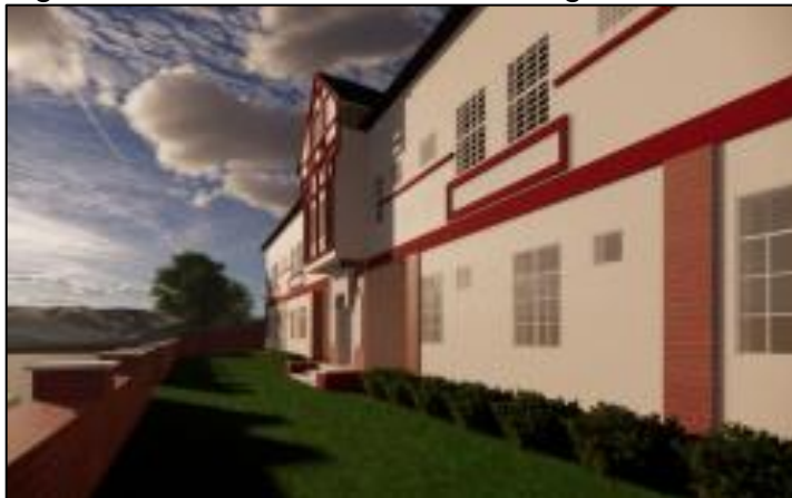
Figura 2 – Fachada frontal vista diagonal

dos acessos verticais que contam com escadas, e um elevador para assegurar a acessibilidade de todas as pessoas. No segundo pavimento foi feita a divisão entre área privada e área social, no setor público é possível encontrar 8 salas de música que variam de 14m 2 a 30m 2 , além de 3 salas de oficina com áreas de 12m 2 e 27m 2 . O terceiro e último pavimento foi separado para área de exposição, contendo um longo salão de aproximadamente 120m 2 (Figura 4), além de depósito e copa auxiliar.